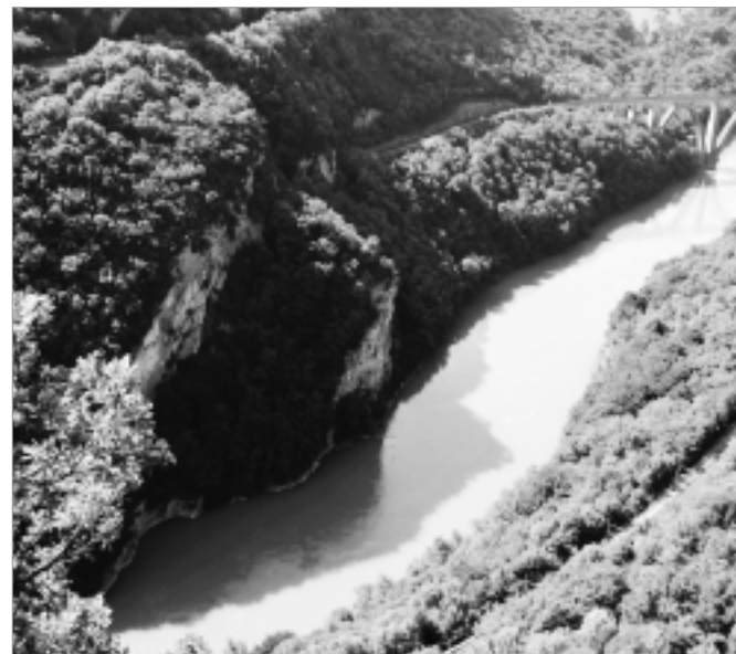
Le Rhône vu de haut

25, Clos-de-la-Fonderie, 1227 Carouge Tél. 022 300 35 35 • Fax 022 300 35 34 e-mail: vernetsa@swissonline.ch