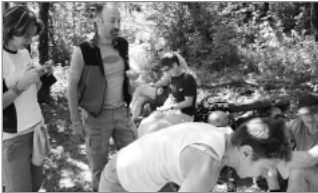
Un repas au repos... avec vue sur le fleuve.