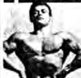
Une poitrine puissante