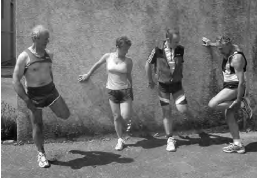
De vrais exercices de stretching...