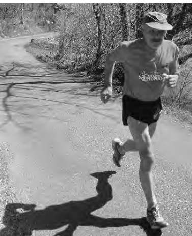
...courir plus vite que son ombre!