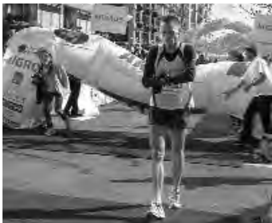
L'arche se dégonfle...