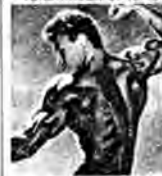
Un dos évasé