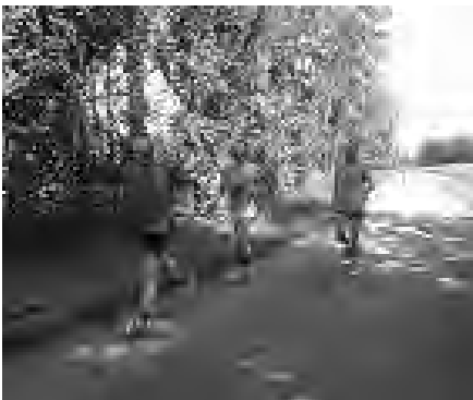
Sur la route de Chaumont