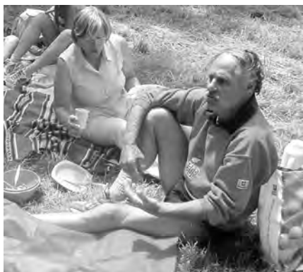
...finalement «il n'y a que là qu'il est bien»!