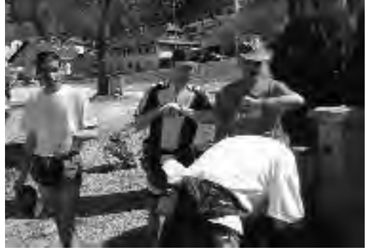
pour être dans les temps!