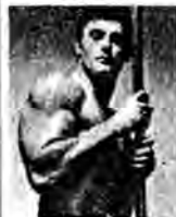
Des bras volumineux et forts