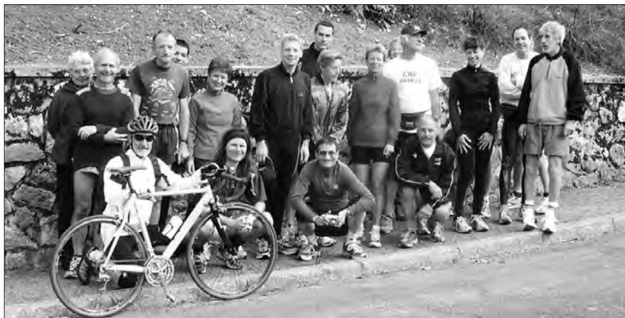
La fine équipe... version 2005, prête pour le tour