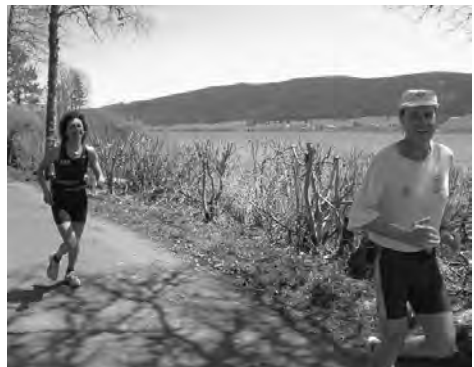
Le tour du lac de Joux est presque bouclé...